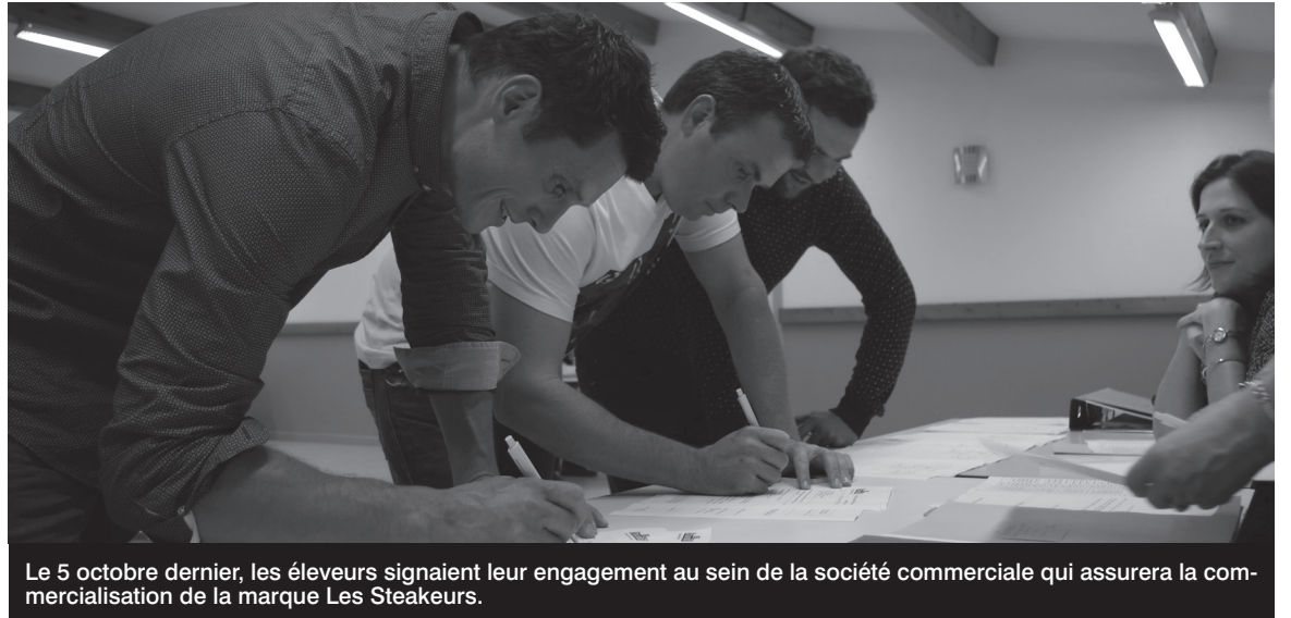
Le 5 octobre dernier, les éleveurs signaient leur engagement au sein de la société commerciale qui assurera la commercialisation de la marque Les Steakeurs.

Pour assurer la mise en marché imminente des produits,